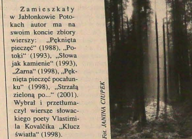
Za m i e s z k a ł y w Jabłonowie Potokach autor ma na wielkim koncie zbiory wierszy...