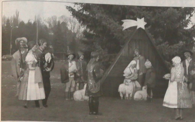
▲ Karwińska szopka bożonarodzeniowa łączy tradycyjne biblijne postaci z postaciami mieszkańców typowymi dla górniczego regionu nad Olzą.