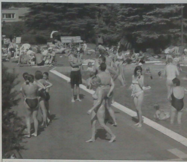
▲ Niemenięszą popularnością od miejskich kąpielisk cieszą się baseny bezkierowniczych ośrodków wypoczynkowych. Na zdjęciu na basenie w Rzece w miniony weekend od roli się od wyznawców kąpeli pod gołym niebem.