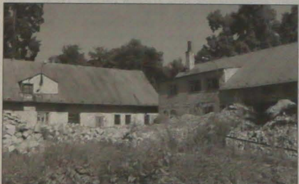
▲ Jakie będą dalsze losy użytkowanego niemal w samym środku Parku im. Bożeny Němcovej w Karwinie-Fryszacie obiektu byłych stajni Larischa, na razie nie wiadomo. Plany jego adaptacji z braku pieniędzy spętają na niczym, a jako że chodzi o zabytek historyczny rozbiora też nie wchodzi w rachubę. Na razie więc miasto będzie właścicielem „stajni” zmuszone jest użyć pieniądze na ich niezbędny konserwację.

– Kolejne nasze przedsięwzięcie to poszerzenie terenów rekreacyjnych koło basenu w Šycle – dodał S. Jakus. – Obecnie ciężarówką nowąż ziemię na działkę sąsiadującą z ogrodzeniem basenu. Następnie teren zostanie wyrównany i obsiany trawą. W przyszłości dzięki temu otoczenie kąpieliska zwiększy się o ponad 2000 metrów kwadratowych.