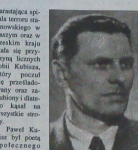
Przebiegiem z boską sprawiedliwością, natomiast wręcz atawistycznie nienawidzi stalinowców...