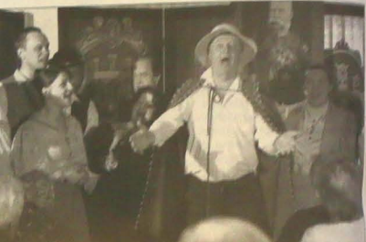
„KAISERMANEWRY” W DOMU POMOCY SPOŁECZNEJ