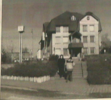
Dawny budynek urzędu gminnego w Bystrzycy...

Nie są wypracowane materiały... (text continues)