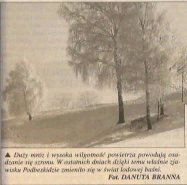
▲ Duży mróz i wysoka wilgotność powietrza powodują osadzenie się szronu. W ostatnich dniach dzięki temu właśnie zjawisku Podbeskidzie zmieniło się w świat lodowej baśni.