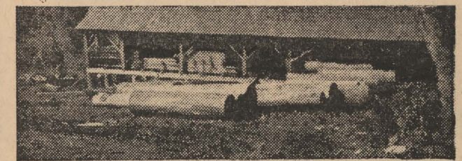
Tartak na kolonii Jagoda