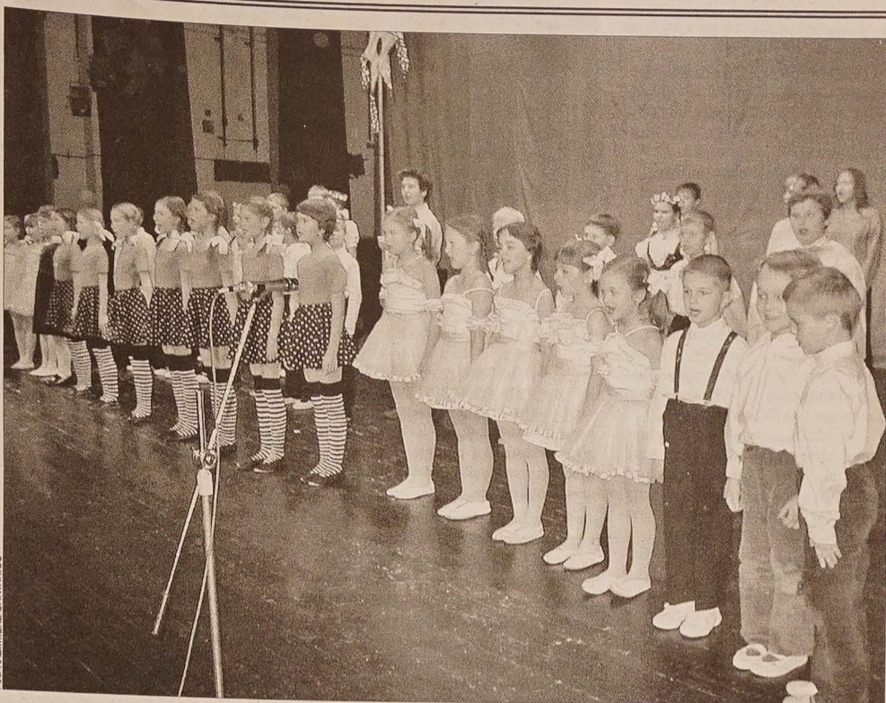
Różnie narybek „Błędowian”. Na zdjęciu rytmika szkolna oraz „Mali Błędowianie”.