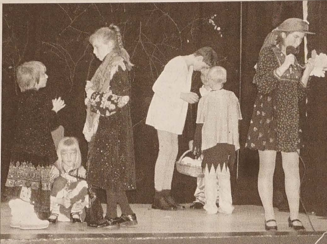
Targowisko z prawdziwego zdarzenia, czyli aktorzy „Gapy 2” w akcji. Można kupić krowę, jajka, marchewki...