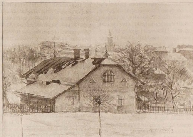
Gustaw Fierla: Orłowa Obroki. Widok na dom p. Łukoszy w zimie. Akwarela 1944.

Tym razem na żaden cud nie można już było liczyć. Lewobrzeżni mieszkańcy Śląska Cieszyńskiego dawno zamienili swój polski patriotyzm w zaolziańską miłość, który pod groźbą utraty dobrego imienia i w ogóle wiarygodności nakazywał im niewstawianie się za Jasiczkiem. Miarą tego nowego, służebnego Polsce, zaolziańskiego patriotyzmu było milczenie przy-