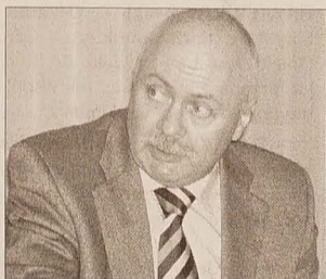
FOT. MARTYNA RADŁOWSKA-OBURUSNIK