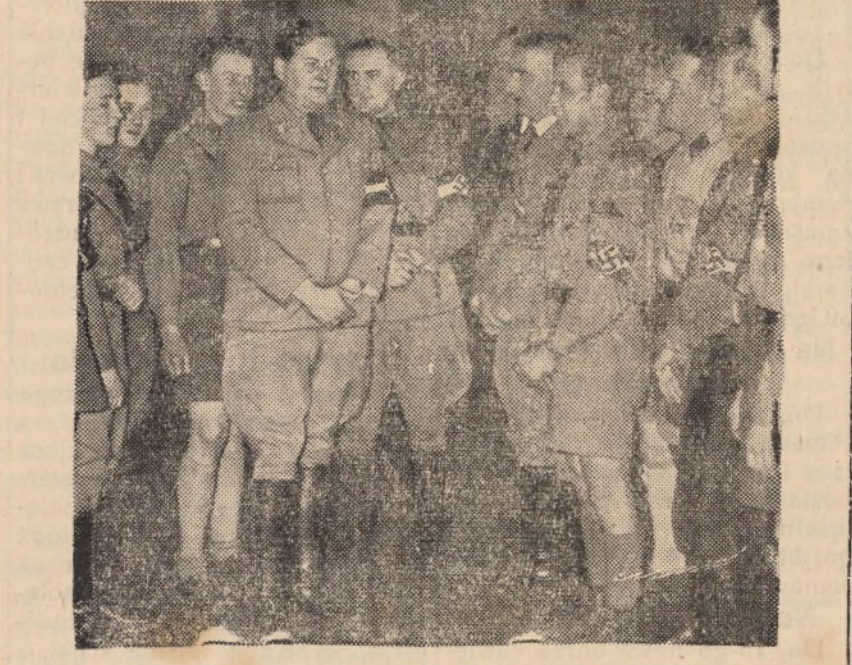
Obrazek z Trzeciej Rzeszy Państwa totalne, a więc Niemcy i Włochy prowadzą swe społeczeństwa po wojskowemu, kładąc przytem wielki nacisk na wychowanie młodzieży w tymże duchu. Na obrazku oddział młodzieży nazystowskiej w Niemczech przy apelurzed komendantem oddziału.

DOM na sprzedaż w Agua Branca, mun. São Mateus, nadający się do handlu, cena bardzo niska. Interesujący się kupnem zechcą zwrócić się do właściciela w Kurtybie — B. Cachery. Michał Samsonowski.