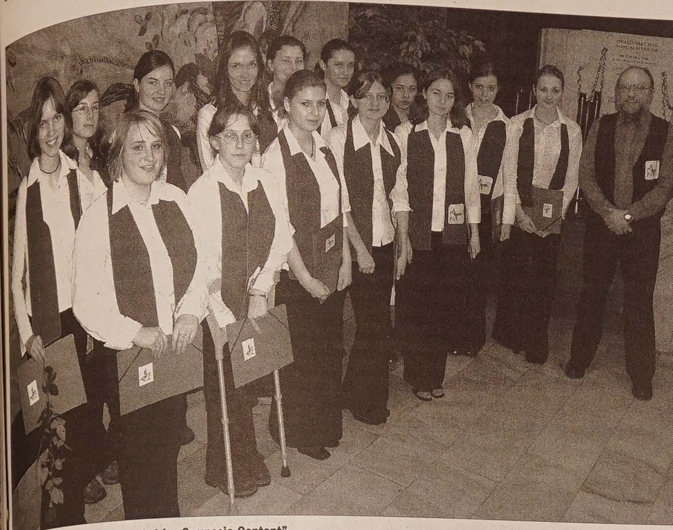
„Alaude” podczas występu na XI przeglądzie „Gymnasia Cantant”.