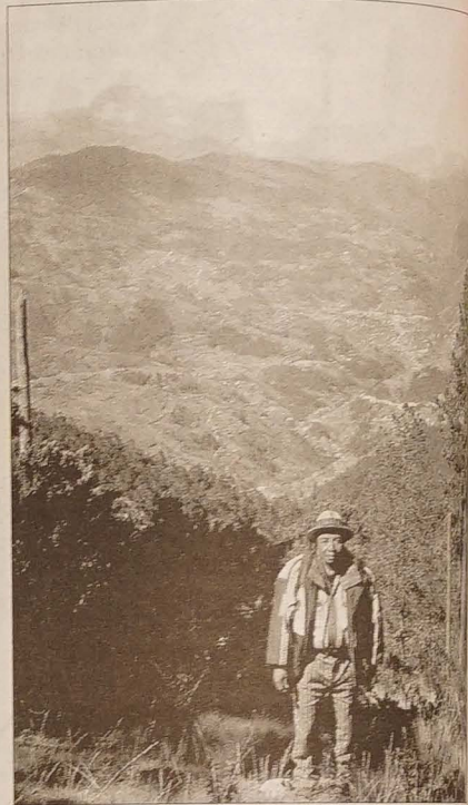
Widok na Todos Santos

Noce zawsze spędzamy na podłodze miejscowych szkół, które często nie wyglądają lepiej niż drewniane chlewy z klepiskiem z grubej warstwy prochu lub gliny. Wieczorem wszystkie dzieci i spora grupa mężczyzn zasiada w szeregu przed szkołą obserwując każdy nasz ruch, każdą czyn-