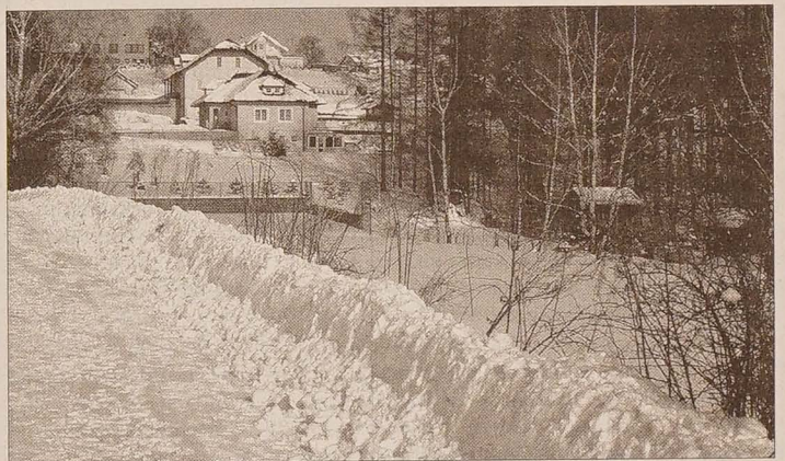
Śniegiem zaspane są nie tylko tereny podgórskie. Tak po sobotnio-niedzielnym opadach wygląda jedna z ulic w Karwinie Raju.