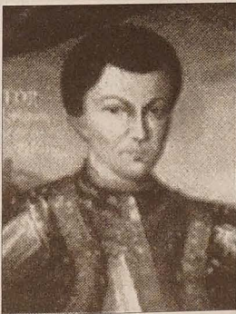
Dymitr Samozwaniec II

D a r e m n i e pierwszy komendant Kremla (Aleksander Gosiewski) będzie się starał w niemniej okrutny sposób powściągać własnych żołnierzy. Kiedy jeden z nich strzelił po pijanemu do prawosławnej ikony Matki Boskiej, dowódca kazał mu odrąbać ręce i nogi, kadłub zaś spaść żywcem na miejscu świętokradztwa. Innego, który spoliczkował popa, Gosiewski chciał ukarać śmiercią; za wstawianiem patriarchy poprzestano na obcięciu winowajcy prawego ramienia. Nie na wiele się to jednak zdało; odpowiedzią na mnożące się gwałty był wybuch powstania mieszkańców Moskwy, jaki nastąpił w marcu 1611 r. Pomimo wsparcia ze strony