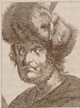
Dymitr Samozwaniec I

Okupujący Moskwę Polacy nie chcieli opuścić Kremla oraz przylegających doń dzielnic miasta. Od sierpnia nie mogli już tego uczynić; do stolicy Rosji przybyło drugie pospolite ruszenie z księciem Dymitrem