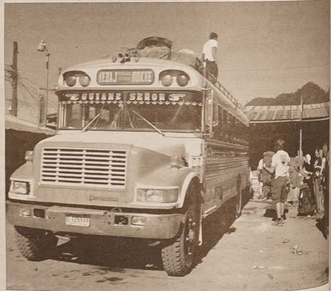
Chicken - bus

ność podczas gotowania posiłku. Dopiero kiedy już leżymy w swoich śpiworach, przyjmując, że wprawdopodobnie już się skończyło i wracając do Wczesnym rankiem znów zaglądają do naszych sprawiają wrażenie zdziwionych, że jeszcze śpiemy.