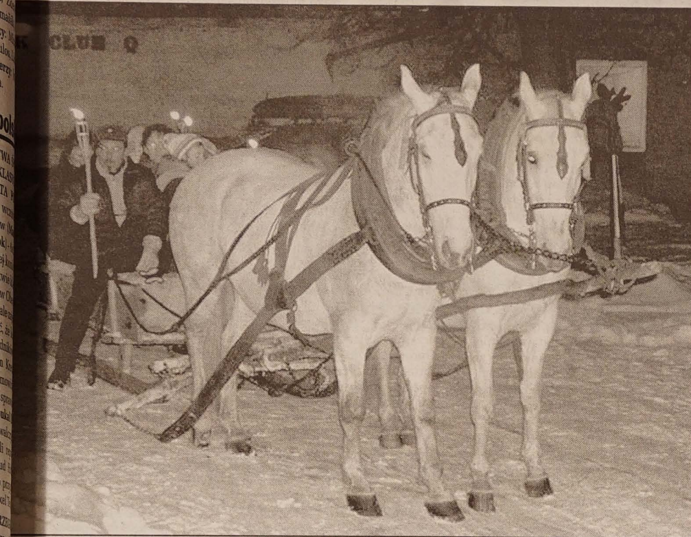
Przebiegu biegu „O Memoriał Jasia Konderli” narciarze wraz ze swymi dziećmi udział w kuligu.