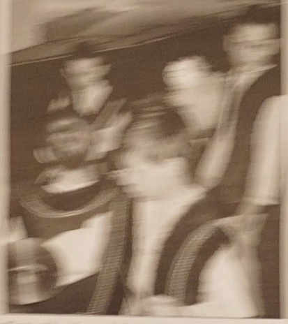
W tym tygodniu w naszym programie...