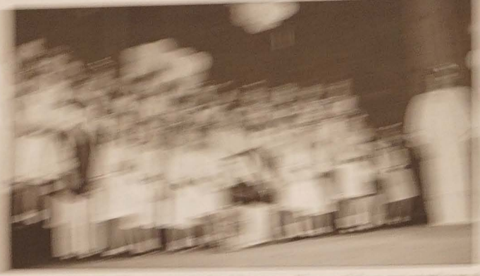
W tym tygodniu w naszym programie...