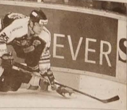
Hawierzowski napastnik Sedlák przyciska do bandy Gombára.

■ TATRAN STRZESZOWICE - TORPEDO PEGRES HAWIERZÓW 4:3 (2:1, 0:0, 2:2). Bramki: 5. Fridrich, 20. Gařar, 55. Horák, 58. Jedlička - 1. Kowal, 50. Krečmer, 58. Kubala. Sędziowali Nováček, Vašíček. Kary 1:1, bez wykorzystania. W 270. Hawierzowanie kapitalnie rozpoczęli finałowy pojedynek w Brnie, już w 1. minucie Kowal na dwa razy wpakował piłeczkę za plecy bramkarza Vozochki. Faworyzowany Tatrano do przerwy przechrzył siał meczu na swoją stronę. W 5. minucie Fridrich po błędnej obrony trafił z kontry na 1:1, a w 20.