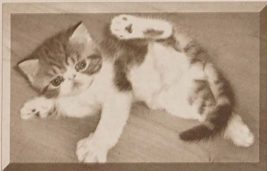
Nie ma to jak kotek. Mruczy, da się pogłaskać i przytulić. Te zwierzątka, podobnie jak pieski, będą prezentem gwiazdkowym w niejednej rodzinie.

dzeniowymi najlepiej sprzedają się papugi (modrolotka czerwono-czarna, afrykanka senegalska i szara tzw. żakło), świnki morskie, chomiki, miniaturowe króliczki, żółwie stepowe i wodne, ale także węże, legwany zielone i... pajęki ptaszniki, przypominające ruda, futrzaną kulkę, o rozmiarach zbliżonych do kobiecej dłoni. (wak)