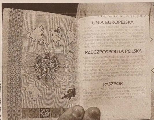
Konsul Michał Gierwatowski ukazuje wzór unijnego paszportu polskiego.

Ta trochę humorystycznie nakreślona przez panią perspektywa wydaje się być prawdopodobna. Postęp techniczny, który przez ostatnie lata bardzo zmienił sposób weryfikacji informacji, powoduje, że rzeczywiste wydaje się możliwa identyfikacja czy to przez odciski palców, czy podpis. Być może w przyszłości takie dane wystarczą, aby przekraczać granice również pozaunijne. A te – z dzisiejszego punktu widzenia trudno przekraczalne – jak np. granica USA, będą się otwierać i zaniknąć. Wszyscy i tak znajdziemy się w europejskiej ewidencji biometrycznej. (mro)