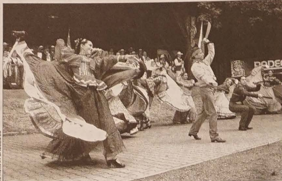
Meksykanie w Jabłonkowie.

Niesygnowane materiały publicystyczne i informacyjne pochodzą z internetowych serwisów informacyjnych.