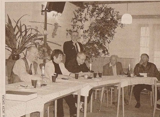
Tegoroczna świętogorolska Kawiarenka „Pod Pegazem” poświęcona była zaoziańskim wydawnictwom z ostatniego 3-lecia.

Kolejne spotkanie „Pod Pegazem” odbędzie się w listopadzie i towarzyszyć będzie Wystawie Polskiej Książki. – Tego, kto będzie jego bohaterem, na razie nie zdradzaj. Będzie to jednak wybitny pisarz z Krakowa – zapewnił Gawlik.