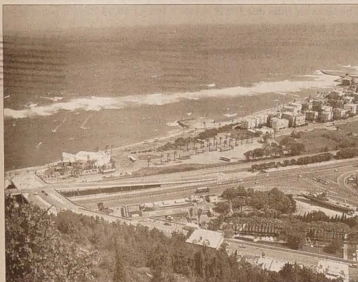
Wybrzeże Morza Śródziemnego w Hajfie na północy Izraela.