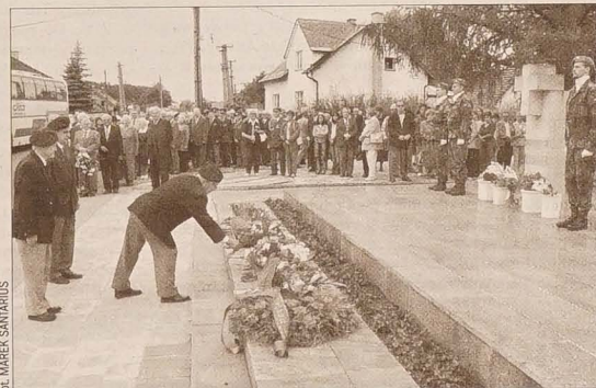
Kwiaty u stóp Pomnika Żywocickiej Matki składa delegacja Kół Polskich Kombatantów w RC.

W hipotetycznym mieszkaniu o powierzchni 60 m kwadratowych, za które obecne regulowane komorne wynosi 2224 korony, a w którym za elektryczność płaci się 784 Kč miesięcznie, w przyszłym roku trzeba będzie w skali 12 miesięcy zapłacić o osiem tysięcy więcej za samo mieszkanie i około 500 koron więcej za elektryczność. Cena gazu wzrośnie w zależności od sytuacji na rynku ropy naftowej.