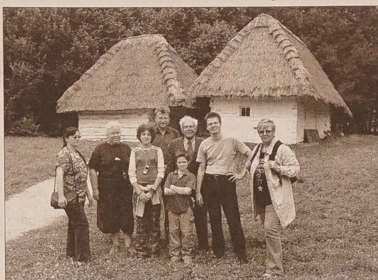
Członkowie Sekcji Ludoznawczej w strażnickim skansenie.

Wnioski o nowe paszporty przyjmować będą magistraty w miastach o poszerzonym zakresie działalności administracyjnej w Karwinie, Hawierzowie, Orłowej, Boguminie, Cz. Cieszyne, Trzyńcu, Jablonkowie i Frydku-Mistku. Składając taki wniosek należy mieć przy sobie dowód osobisty, pokwitowanie opłaty paszportowej, dwie fotografie nie starsze niż pół roku oraz znaczek skarbowy. Z kolei przy odbiorze nowego paszportu należy mieć przy sobie stary. (wak)