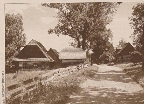
Skansen Veselý Kopec koło Hlinska.

Polecamy tę trasę wszystkim, którym znużliła się autostrada Praga – Olomuniec. Przepiękne widoki, po drodze można obejrzeć Hlinsko i Veselý Kopec. A poza tym nie tylko dla ducha, ale i dla ciała coś się znajdzie. W osadzie Veselý Kopec w restauracji „U Kováře Matěje” można zjeść pyszny gulasz z jelenia, a w Betlémie supersmaczne grundle..... WIESŁAWA BRANNA