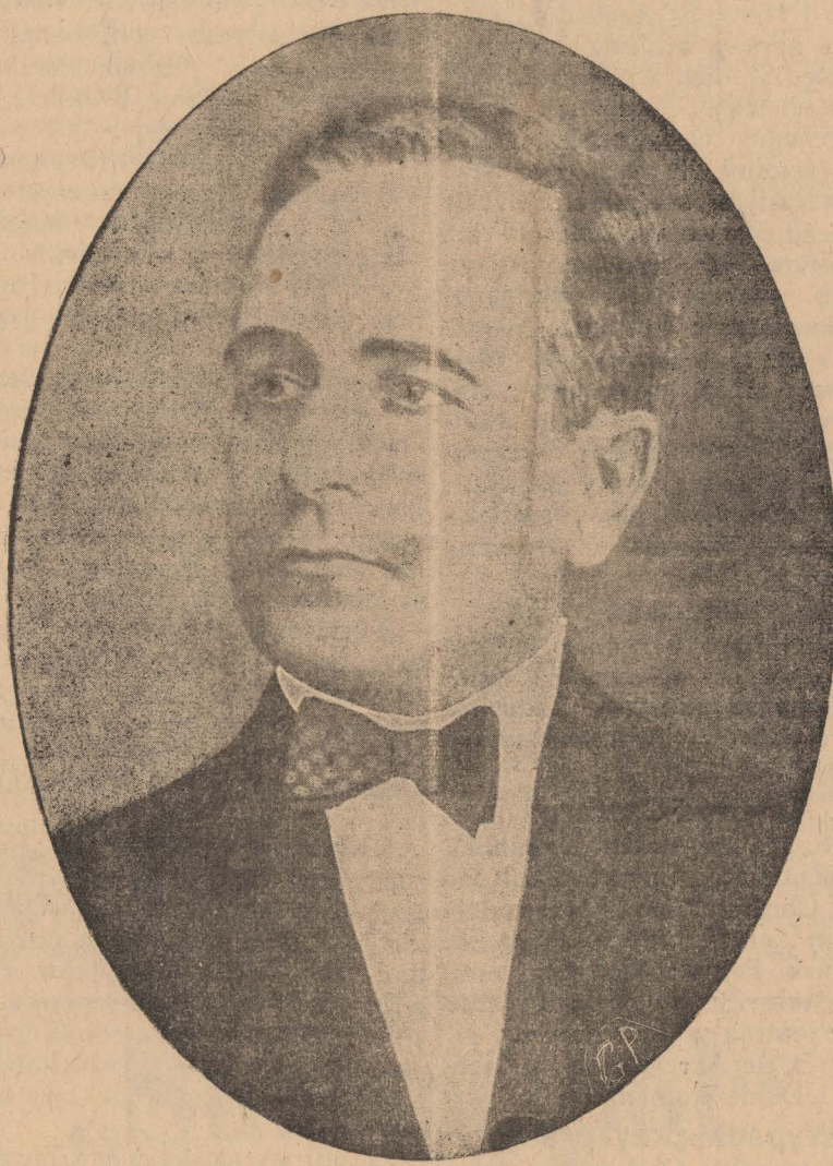
DR. GETULIO VARGAS PREZYDENT STANÓW ZJEDNOCZONYCH BRAZYLIJI