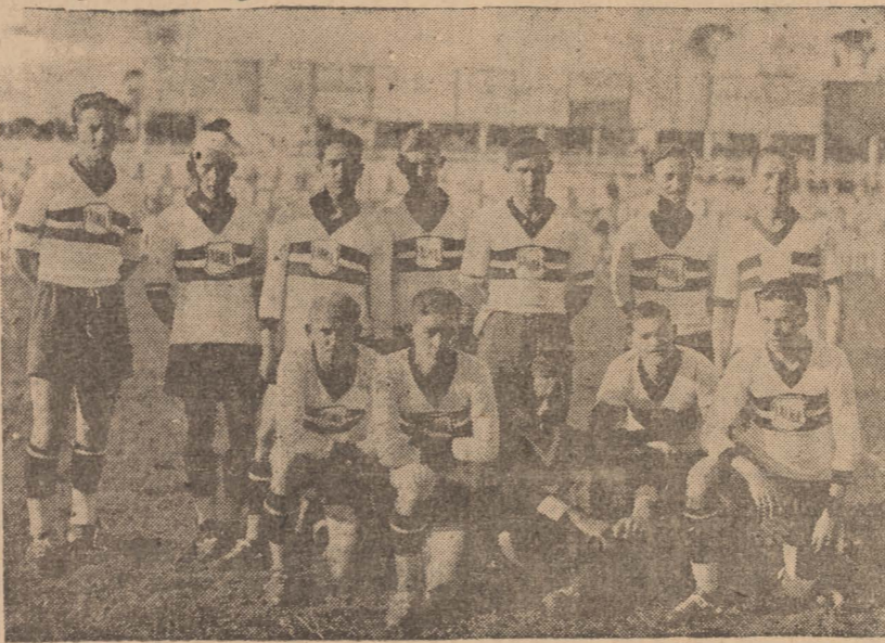
Drużyna piłki nożnej dawniejszego Junaka

W Kurytybie nastąpiły obecnie wakacje sportowe, przerwa pomiędzy pierwszą a drugą częścią zawodów piłki nożnej, która, jako sport wybitnie widowiskowy, tak bardzo emocjonuje ludność miejską dzisiejszych czasów. Dawniejszy Junak a obecny Juventus uzyskał w tej 1-szej części zaszczytną pozycję, odpowiadającą jego świetnym tradycjom. W kolach sportowych mówi się dużo o naszej wybitnej drużynie piłkarskiej, która uchodzi za jednego z najsilniejszych kandydatów do tytułu „Mistrza Parany na rok 1938”.