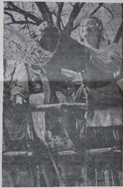
"SMIGUS-DYNGUS", secular costume polonês de molhar as pessoas depois das festas da Páscoa.

(Traduzido da Revista espanhola "Mensageiro", n.º 997, pág. 59).