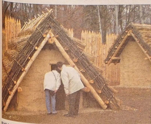
W takich właśnie ziemiankach, krytych słomą lub trzcina, żyli przed wiekami nasi przodkowie.