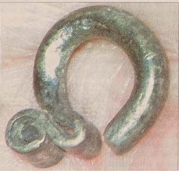
Do bardzo wartościowych przedmiotów znalezionych na grodzisku w zeszłym sezonie należy niewątpliwie kolczyk ze srebra, zwany zauszniką.

Ukoronowaniem dotychczasowych badań jest Park Archeologiczny powstający na obszarze dawnego grodziska. Gałość zajmuje powierzchnię jednego hektara i 74 arów. Systematyczna odbudowa dawnego grodziska z okresu słowiańskiego trwa tu od roku 2001. Archeolodzy starają się odtworzyć obraz dawnego życia naszych przodków. Zdaniem Pavla Kouřila, przy budowie skansenu wzorowano się głównie na polskim Biskupinie. Za wałem obronnym z drewnianą palisadą, wielką bramą, do której prowadzi most zwodzony, wyrosły ziemianki kryte trzcina i słomą oraz chata słowiańska o rozmiarach 20 razy 3,5 metra, w której wódz wraz ze swoją drużyną odbywał narady w ważnych dla grodu sprawach. Wszystko budowane jest z jody zwożonej z całego kraju i to bez gwoździ, drutu, betonu. Po prostu w oryginalny sposób, taki sam, jaki stosowano przed wiekami. Wieża, łącznie