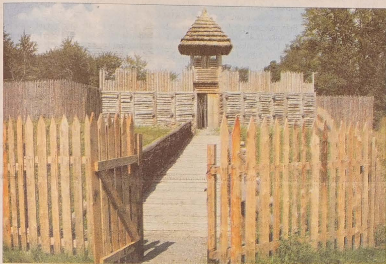
Do grodziska prowadzi most o długości 12 metrów i brama z wieżą, wszystko wykonane jest z jody bez jednego gwoździa.

Zwiedzanie Parku Archeologicznego będzie na pewno bardzo atrakcyjne dla wszystkich, w szczególności dla dzieci i młodzieży, jednak na razie,