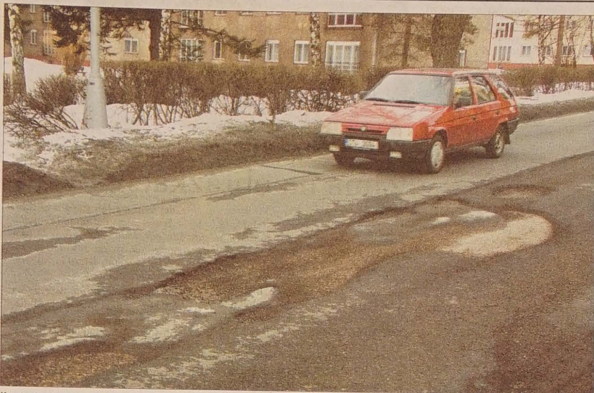
Koszty zimowego utrzymania dróg zwiellokrotniła cena, którą odpowiednie służby będą musiały wydać na naprawę szkód, jakie śnieg i mróz wyrządziły na nawierzchniach jezdni. Dziur w asfalcie jest tyle, że drogowcom będzie trudno je załatać do... następnej zimy. Na zdjęciu: wyloty na ulicy Ostrawskiej w Cz. Cieszynie, drodze wylotowej w stronę Hawierzowa i Ostrawy.