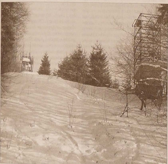
Widok spod skoczni K 68 w Nydku.