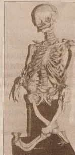
Szkielet dziecka z rażącymi rachitycznymi zniekształceniami dolnych kończyn i kręgosłupa pochodzący z prac wykopaliskowych w Grenlandii.

2. pytanie kontrolne: Która pora dnia pogarsza stan naszego układu kostnego i która pora dnia? Odpowiedź: W następnym odcinku.