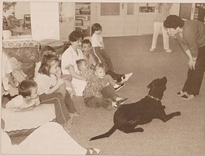
Julka słucha instrukcji swojej pani, by w kilka sekund później bawić się z dziećmi.

Przez cały ubiegły tydzień przebiegała w tej placówce dogoterapia, czyli zajęcia, w których główną rolę odgrywał pies. Dogoterapia jest jedną z metod terapii, która w swoich założeniach wykorzystuje pozytywne oddziaływanie tego właśnie czworonoga na człowieka. Ma na celu przywrócenie zdrowia i dobrego samopoczucia. Służy wzmacnianiu działań prowadzonych przez lekarzy, rehabilitantów, pedagogów. Udział psa w prowadzonych zajęciach pomaga szybciej i skuteczniej osiągnąć zakładane cele terapeutyczne. Warto jednak w tym miejscu podkreślić, że pies nie jest terapeutą. Terapeutą jest człowiek, który opracowuje terapię, kieruje jej przebiegiem, rozmawia z dzieckiem. Pies jest pomocnikiem, „katalizatorem” zamierzeń.