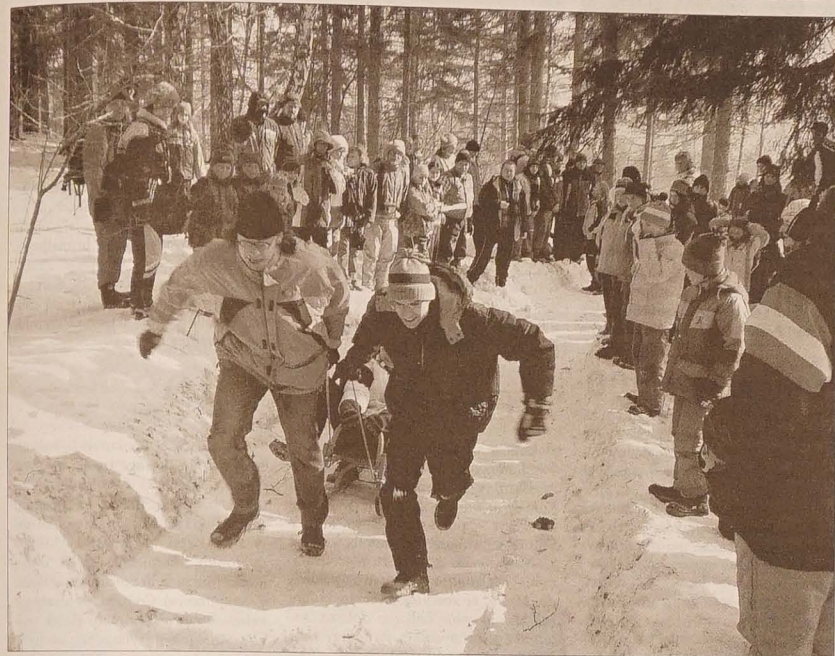
W kulgu saneczkowym będącym jedną z konkurencji konkursu sprawnościowego pokazali swoją krzepę również ojcowie uczniów.

tel.: 558 731 766 faks: 558 740 044 info@glosludu.cz