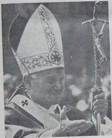
JAN PAWEŁ II, niezmordowany duszpasterz całego Kościoła, kieruje jego odnowę.