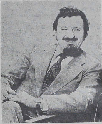
Dr Stanisław Burzyński — założyciel Instytutu Badań Rakowych w Houston (USA).