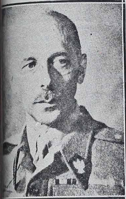
BOR KOMOROWSKI — bohater wojny wiodąca Powstania Warszawskiego.

przeciwko żywotnym interesom narodu polskiego” —