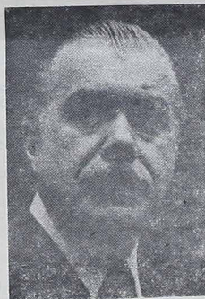
JOSE SARNEY, były szef rządowej partii PDS, opuścił szereg partii, by przyłączyć się do Frontu Liberalnego. Jego ustąpienie, celem zjednoczenia PDS, nie daly rezultatu.

Dnia 24 lipca br. Front Narodowy powziął decyzję, by sprzymierzyć się z PMDB, stawiając jako wspólnego kandydata gubernatora Minas Gerais — Tancredo Neves. Szef tego Frontu — Aureliano Chaves przekonał się naocznie, że nie ma mowy o zjednoczeniu rządowej partii PDS. Ostatecznie kandydatów: Mário Andreazza, Paulo Maluf i Tancredo Neves. By wystawić jeszcze jednego kandydata — brak na to czasu.