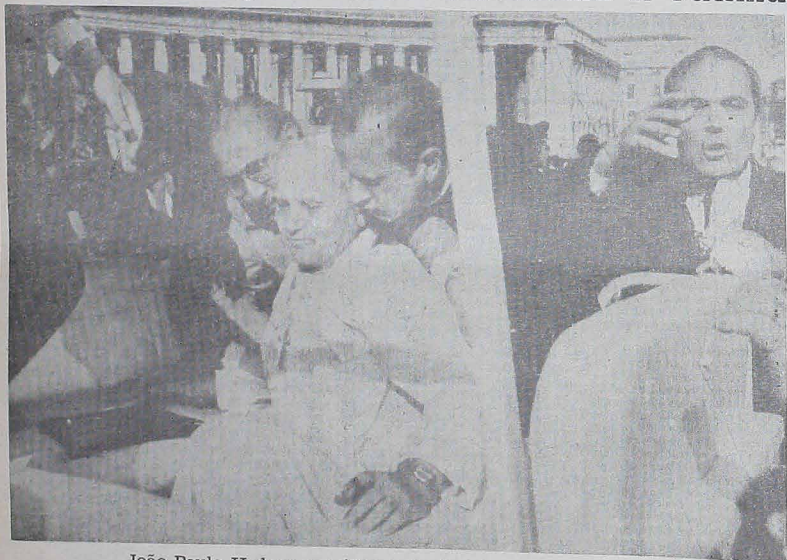
João Paulo II doou, no último dia 13 de maio, ao mosteiro de Fátima, Portugal, a bala que o atingiu no atentado que sofreu a 13 de maio de 1981. A doação foi anunciada, ao término da peregrinação internacional à Fátima, por Dom Alberto Cosme do Amaral.