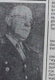
REYNALDO BIGNONE, prezydent Argentyny, obrany przez Juntę wojskową...