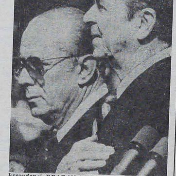
Prezydenci REAGAN i FIGUEIREDO odbyli szereg rozmów na temat polityki międzynarodowej...