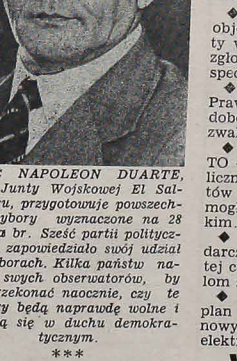
JOSE NAPOLEON DUARTE , szef Junty Wojskowej El Salvadoru, przygotowany pouszechnie wybory wyznaczone na 28 marca br. Sześć partii politycznych, zapowiedziało swój udział w wyborach. Kilka państw nadesłało swych obserwatorów, by się przekonać naocznie, czy te wybory będą naprawdę wolne i odbędą się w duchu demokratycznym.