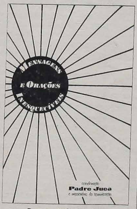
Preço: Cr$ 200,00