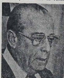
Prezydent FIGUEIREDO odbył trzydniową oficjalną wizytę w Peru. Była to pierwsza wizyta Prezydenta Brazylii w tym kraju, który nie przyjmował w ciągu rządów wojskowych wizyt szefów państw zagranicznych. Jednakże rząd peruwiański prezydenta Belandere Terry uznał, że rozwój Peru zależy od nawiązania ścisłej współpracy z Brazylią.

W ubiegłym tygodniu, w dniach od 24 do 27 p. Prezydent był oficjalnym gościem Peru. W przeddzień tej wizyty prezydent brazylijski Belandere Terry oświadczył w programie telewizyjnym, że jego spotkanie z Prezydentem Brazylii będzie miało wielkie znaczenie w zwiększeniu wymiany handlowej, w współpracy na polu przemysłowym, technicznym i kulturalnym. Głównym tematem rozmów między obydwojema Szefami Brazylii i Peru była budowa odcinka drogi łączącej miasto peruwiańskie Inapari z miejscowością brazylijską Assis Brasil poprzez most na rzece Madre de Rios. Nie mniej ważnym punktem tego spotkania była realizacja planu polaczenia dorzeczy 3 rzek: Orinoco, Amazonas i La Plata. To zagadnienie będzie szczegółowo rozpatrywane w październiku br. między Brazylią, Peru i Argentyną.