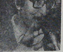
BANI SADR, pierwszy prezydent Republiki Irańskiej w Iranie (po upadku cesarstwa dynastii Pahlewi), został usunięty ze swego stanowiska przez parlament Iranu pod zarzutem zdrady stanu. Bani Sadr znajduje się wśród postulatów Kurdów walczących w Iranie o swą autonomię. Partia Demokratyczna Kurdów nie jest uznawana przez Khomeinego.

po swojej stronie jedynie 12 posłów. W międzyczasie Khomeini zażądał od Bani Sadr, by wystąpił w radiu i telewizji i publicznie poprosił naród o przebaczenie za to, że nawoływał go do buntu. Bani Sadr nie odważył się jednak wystąpić publicznie, wysłał tylko odroczony list do Khomeinego, wyrażając mu swą wierność i lojalność i podkreślając, że jego przeciwnicy polityczni dopuścili się wien kłamstw pod jego adresem. Na trzeciej z kolei sesji parlamentu BANI SADR został usunięty ze stanowiska i prezydenta Republiki Irańskiej. Oskarżony o zdradę stanu — grozi mu więzienie a nawet kara śmierci. Dotychczasowi przywódcy Khomeinego nie zdołali aresztować byłego prezydenta, który znajduje się w ukryciu a może już zbliżył się do granicy. Posiada on dom w Paryżu, w którym mieszka jego dwie córki. Tymczasem 43 współpracowników Bani Sadr zostało rozstrzelanych.