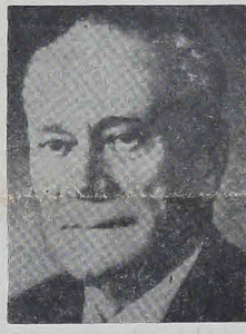
TICHONOW, nowy premier sowiecki (po zgonie Kosygina) jest człowiekiem Breżniewa.