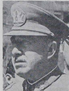
Gen. PINOCHET, prezydent Junty Wojskowej w Chile, gości się na rozstrzygnięcie sporu z Argentyną o Kanał Beagle zgodnie z decyzją Papieża Jana Pawła II.

Według komentarzy prasy argentyńskiej — propozycja