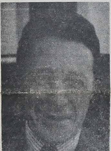
CASPAR WEINBERGER będzie sekretarzem Obrony w rządzie prezydenta Reagana.

torą nie wygra wyborów, choćby otrzymał większość głosów w swoim stanie.