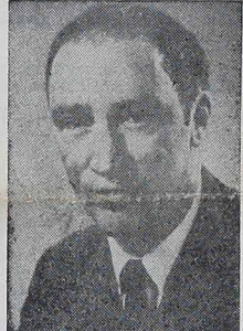
PIERRE TRUDEAU, premier Kanady, był oficjalnym gościem Brazylii.