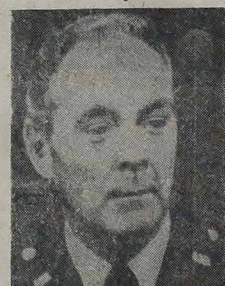
GEN. ALEXANDER HAIG JR. otrzymał nominację na Sekretarza Stanu. Był kawalerką kariery. Haiga zaczęła się od 44 roku życia, gdy jako pułkownik odbył służbę wojskową w Japonii, Korei i Wietnamie. W 1967 r. Henry Kissinger powierzył mu stanowisko osobistego doradcy. W 1972 r. został mianowany przez Richarda Nixona generałem do 4 gwiazdek, zastawiając w tym 240 innych generałów USA. Z kolei objął on urząd gubernatora Nizony, a ukończył objął naczelne dowództwo NATO.

Ronald Reagan, który 20 stycznia obejmie rząd prezydenta Stanów Zjednoczonych, sformował już swój gabinet złożony z 9 sekretarzy. Większość z nich zalicza się do konserwatyistów i do oddanych przyjaciół nowoobranego prezydenta. Nowi sekretarze są to ludzie w starszym wieku (najmłodszy z nich liczy 34 lat), którzy mają za sobą wielkie sukcesy zdobyte w różnych sektorach życia państwowego. O nich wyrzyl się Reagan, że są to ludzie, którym nie zależy na wejściu do rządu.