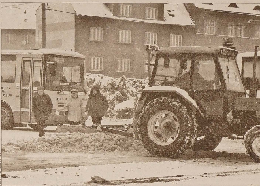
Drogowcy w Czeskim Cieszynie stanęli na wysokości zadania i poradzili sobie z pierwszym w tym roku atakiem zimy.