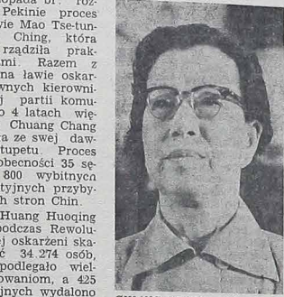
CHIANG CHING - wdowa po zmarłym uszczepionym szefie Chin komunistycznych, - Mao Tse-tung, zasiadała na ławie oskarżonych 6 dawnych kierowniczych chińskiej partii komunistycznej. Po 4 latach więzienia wdowa Chuang Ching nie straciła ze swej dawnej dumy i tupeju. Proces toczy się w obecności 35 sędziów oraz 800 wybitnych członków partyjnych przybyłych z różnych stron Chin.

Procedura Huang Huoqing wyjawiał, że podczas Rewolucji Kulturalnej oskarżeni skazani na śmierć 34 274 osób, 727 420 osób podlegało wielkim przesładowaniom, a 425 liderów partyjnych wydalono z partii i z ważnych stanowisk. Kilku z oskarżonych odpowiada za przestępstwo zdrady stanu, ponieważ wzięło udział w nieudanym zamachu stanu kierowanym przez marszałka Lin Biao w 1971 roku. Należeli oni do jego sztabu generalnego.