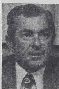
Pulik RUBEM LUDWIGO, mianowany ostatnio generałem brygady przez p. Prezydenta, otrzymał w tych dniach nominację na ministra Wychowania w miejsce ministra Eduarda Portela, który podał się do dymisji. Portela od dłuższego już czasu walczył bez skutku o reformę systemu nauczania w kraju. Na jego dymisję wpłynęły także strajki profesorów w 19-tu Uniwersytetach.

Od czasu gdy Kongres zatwierdził jednomyslnie projekt rządowy odnoszący się do wolnych wyborów na gubernatorów w 1982 roku, poszczególne partie polityczne rozwijają swą działalność w poszukiwaniu kandydatów na stanowisko. Na razie partie wystawiają po kilku kandydatów, by na konwencjach partyjnych zdecydować, kto będzie ich oficjalnym kandydatem w wyborach.