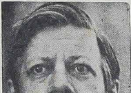
kanclerz RFN — HELMUT SCHMIDT wygrał wybory do parlamentu dzięki koalicji swojej Partii Socjaldemokratycznej z Partią Liberalną. Stąd jego polityka "ostpolitik" — jak wszystko wskazuje — będzie utrzymana. Jego rywali Strauss — kandydat zjednoczonych dwóch partii demokratycznych wyznaczeni "realpolitik", czyli byli przeciwni dalszemu utrzymaniu "dentysty".

Jeśli Episkopat niemiecki stanął po stronie chrześcijańskiej demokracji, to przede wszystkim dlatego, że socjaldemokracy popierali otwarcie przerywanie ciąży. Należy pamiętać, że katolicy stanowią 45 procent ludności RFN na 61 milionów mieszkańców. Reszta to protestanci różnych sekt. Wielki doboryt był (roczny dochód na głowę 7 810 dolarów) sprawiło, że zmniejszyła się zastraszająca liczba urodzin (9,5 na 1 000 mieszkańców). Unika się dzieci, by nie mieć z nimi kłopotów rodzicielskich.