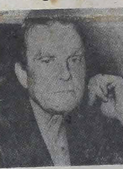
CZEŚLAW MIŁOSZ, jeden z najwybitniejszych poetów polskich czasów obecnych, otrzymał Nagrodę Nobla z Literatury w sumie 212 tys. dolarów. Czesław Miłosz urodził się na Litwie w 1911 roku. Studia odbył w Wilnie. Pierwszy zbiór jego poezji ukazał się w 1933 roku, za

która otrzymał nagrodę pozostającą do tej chwili w Warszawie (1934-35). Wojnę przeżywał w Polsce. W latach 1945-55 był attaché kulturalnym PRL w Nowym Jorku. W 1955 zerwał z PRL i osiadł w Niemczech. W 1958 otrzymał Nagrodę Nobla z Literatury. Pożyczał się do literatury i sztuki. Posiada liczne krewnych w Polsce, m. in. rodzonego brata. Nagroda Nobla z Literatury zostanie mu wręczona 10 grudnia br. Czesław Miłosz jest kłanem polskim laureatem Nagrody Nobla z Literatury. Pierwszym był znakomity pisarz Henryk Sienkiewicz (1905) za dzieło QUO VADIS. Drugim był autor powieści: Chłopek, autor CHEŁPOW. Czesław Miłosz jest obecnie profesorem języków i literatury na Uniwersytecie w Kalifornii (USA).