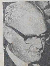
CHAGAS FREITAS, obecny Gubernator stanu rioskiego, zalicza się wprawdzie do opozycji, lecz na razie nie może opozycja liczyć, że względu na pogmatwaną politykę lokalną. Stan rioski sam w sobie zalicza się do najsilniejszych bastionów opozycyjnego.

W wyborach 1982 roku partie opozycyjne mogą uzyskać więcej senatorów aniżeli partia rządowa PDS. Jednakże o partii rządowej wystarczyło dwóch senatorów więcej, aby sobie zapewnić większość w Senacie. Na te same wieki zanoszą się w Federacji Lebie, Deputowanych. Nie więc daliśmy, że wśród liderów partii, w szczególności, jak np. PMWB, PP, PDT i PT — odzwalają się silne głosy, by w obliczu wyborów w 1982 r. wszystkie partie opozycyjne zjednoczyły się we wspólny blok.