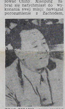
ZHAO ZIYANG, nowy premier Chin liczący 61 lat, ma za zadanie przejąć kierownictwo nad partią komunistyczną, odwołując komunistów z szeregów. Dawny premier Hua Guofeng, wicepremier Deng Xiaoping oraz inni byli wicepremierzy poddali się do dyspozycji.

W Pekinie odbył się kilkunastodniowy Narodoowy Kongres Ludu, który miał za zadanie odmłodzić kadry liderów partii komunistycznej. Obecni główni liderzy PK nie chcą krytykować Guo-fenga. Deng Xiaoping mieli zrezygnować ze swych stanowisk premiera i wicepremiera, zachowując szefostwo partii chińskiej.