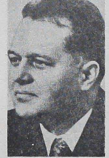
STANISŁAW KANIA, który objął urząd w PRL na miejsce Edwarda Gierki, wobec kilku nowych strajków w 5 miastach, zapowiedział, że strajki te mogą unicestwić ostagmienie robotników w Gdańsku. Zapowiedział również decentralizację ekonomii w Polsce.

Dnia 6 września br. cała prasa światowa podała wiadomość, że dotychczasowy I sekretarz partii PRL Edward Gierk zostawia urząd na 10 lat, a jego następcą zostanie Stanisław Kania.