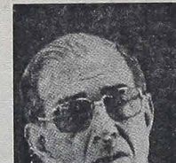
Brigadier DELIO JARDIM DE MATTOS, minister Lotnictwa, uwielbiał się bardzo pochlebnie pod adresem nowego treningowego myśliwca brazylijskiego T-27, który zostanie nie tylko ucielony do krajowych sił lotniczych, lecz także powinien znaleźć licznych klientów zagranicznych.

EMBRAER — czyli Brazylijskie Zakłady Lotnicze w S. José dos Campos przeprowadziło ostatnio bardzo udaną próbę z najnowszym modelem brazylijskiego ćwiczeniowego samolotu wojskowego T-27, jest to najlepszy samolot przystosowany do lotów treningowych, jaki już ukazał się w różnych państwach.