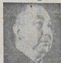
Premier HUA GUOFENG, na ostatniej sesji KC postanowił skłonić z personalnym kultem Mao Tse-tunga. Ogromne portrety tego ostatniego zostały ograniczone do kilku. Inne usunięto z gmachów publicznych. Zabroniono również wnoszenia pomników na cześć zasłużonych weteranów chińskiej partii komunistycznej.

Na ostatniej sesji Komitetu Centralnego postanowiono o słońcu z kultem personalnym w Chinach i z ubóstwianiem zmarłego dyktatora Mao Tse-tunga. Komisja Centralna partii oczekuje, że powinno usunąć portrety Mao z placów publicznych znajdujących się na każdym kroku. Zabrania się również stawiania pomników starym i zasłużonym liderom rewolucyjnym. To bowiem uchybia godności politycznej Chin.