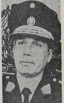
Gen. FRANCISCO MORALES BERMUDES, obecny prezydent Peru, po kilkuletnich rządach wojskowych ma wkrótce oddać władzę nad państwem w ręce kandydata, czyli w osobie Fernando Belaunde Terry. Ten ostatni wygrał wybory na prezydenta z ramienia partii Akcja Ludowej. Zwyklejsi kandydaci cieszy się poparciem ze strony obecnego rządu.

Wybory na prezydenta państwa, które odbyły się w Peru dnia 18 maja br., przyniosły zwycięstwo kandydatowi partii Akcja Ludowa tj. Fernando Belaunde Terry. Rywalem jego był kandydat partii Rewolucyjnej Alians Ludowy — Armando Villanueva del Campo. Fernando Belaunde Terry zajmował urząd prezydenta kilka lat wstecz, lecz usunięty został ze stanowiska przez gen. Velasco Alvarado dzięki ułomnemu zamachowi w 1975. Wcielając kandydatów, Belaunde miał stawić czoło opozycji politycznej z partii która przegrała wybory oraz ze skrajnej lewicy.