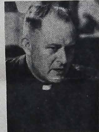
Dom Aloisio Lorscheider, Cardeal - Arcebispo de Fortaleza.

O Congresso Eucarístico está sendo preparado de tal forma que os congressistas tenham contato com a Igreja local. "Haverá na celebração do Congresso uma descentralização de todos os participantes, de sorte que possam ter um contato com a Igreja local", informou Dom Aloisio Lorscheider.