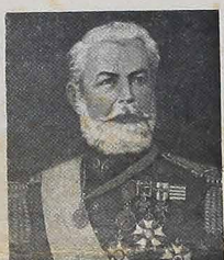
DUQUE DE CAXIAS , pacyfikator czterech rewolucji za panowania cesarza D. Pedro II, w całej pełni zasłużył sobie na miano "Patrona Armii Brazylijskiej". Z okazji 100-letniej rocznicy jego zgonu, przedłożony 7 maja br. wyszczególniono wojskowe w Brazylii obchodzący z wielkimi honorami — te wielką dla nich datę.