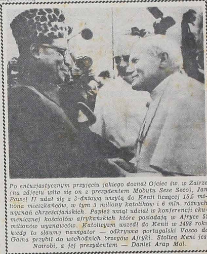
Po entuzjastycznym przyjęciu jakiegoś doznał Ojciec św. w Zairze na zdjęciu ujął się on z prezydentem Mobutu Sese Seko, Jan Paweł II ujął się z 3-dniową wizytą do Kinshazy liczącej 15,5 miliona mieszkańców, w tym 3 miliony katolików i 6 mln. różnych wyznań chrześcijańskich. Papież wziął udział w konferencji ekumenicznej Kościołów, które postępują w Afryce 55 milionów wyznawców. Katolikiem wszedł do Keni w 1488 roku kiedy to sławny navigator — odkrywca portugalski Vasco da Gama przybył do wschodnich brzozev Afryki. Stolicę Keni jest Nairobi, a jej prezydentem — Daniel Arap Moi.

Zair, jeden z największych państw zwiędzanych obecnie przez Papieża, liczy ponad 27 milionów mieszkańców, a jego powierzchnia wynosi 2 375 400 km kwadratowych. Oficjalnym językiem jest francuski. Prezydent Mobutu rządzi krajem od 1965 roku, po udanym zamachu stanu. Stolica Kinshasa liczy ponad 2 miliony mieszkańców. Bogactwa naturalne: miedź, złoto, diamenty, mangan i cyna.