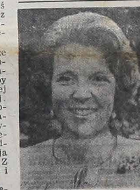
Księżniczka BEATRZYCA (lat 42) zamężna z dyplomata niemieckim Claus von Amserg, obięta tron Holandii po rezygnacji królowej — matki Juljany. Rezygnacja ta była zaszkoczeniem dla całego społeczeństwa Holandii, które uważało kierownictwo państwa jeszcze przez kilka konamniej lat. Objeccie tronu przez księżniczkę Beatrice odbyło się z ueszytkimi honorami i ceremoniami koronacyjnymi dnia 30 kwietnia br.

tarczy poradzić się lekarza na temat metody Billings. Metodę tę zaleca Kościół katolicki.