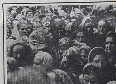
Fontmto 63-letnich rządów komunistycznych w Rosji, ponad 30 milionów mieszkańców należy do Kościoła prawosławnego...

Tak wygląda projekt POLONORTE i POLONOROESTE.