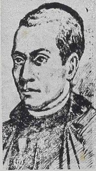
Pe. JOSÉ MAURICIO, największy kompozytor brazylijskiego XVII wieku...