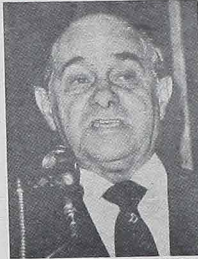
Senator TANCREDO NEVES, szef partii ludowej (PP)...