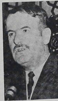
HAFEZ ASSAD, prezydent Syrii, ma przed sobą słałą opozycję...