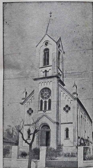
O vitral em homenagem ao Papa João Paulo II ficará na Igreja de Santo Estanislau, atual Paróquia dos Poloneses.

A obra foi entregue à Vidroarte, firma curitibana, especializada na confecção de vitrais, e pretende fazer um histórico da vida do Papa Wojtyła, consta basicamente de um retrato em estilo clássico de João Paulo, tendo como fundo uma representação da abadia polonesa em que residia o papa. Embaixo, ficará o brasão da Igreja Católica na Polónia e o conjunto será elaborado com motivos poloneses.