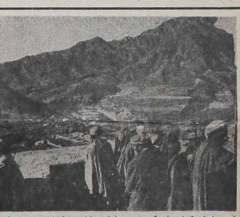
Mahometanscy powstańcy Algierian, choć niedostatecznie uzbrojeni, stawiają dzielnie czoło czołgom, bombowcom i helikopterom sowieckim, wykorzystując gorące tereny tego kraju, jak również swe wielkie doświadczenie w walkach partyzanckich z ubiegłych lat. Ich bohaterka postawa i ustatczona zbrojna akcja zmusza 100-tysięczne oddziały sowieckie do strzeżenia wszystkich miast i ważnych dróg. Mówi się, że nowe oddziały wysłała Moskwa do Algierian, by łatwiej złamać opór powstańców algierian. Na zdjęciu grupa powstańców strzegących ważny odcinek drogi. Algierian to taktyki brawurowej stawia podczas inwazji hitlerowskiej w okresie drugiej wojny światowej.

Wielkość szpitali uległaby zagładzie, z liczbą zaś 6.500 lekarzy 5 tys. zginęłoby, a jedynie 900 młodych sily, by nieść pomoc ofiarom eksplozji nuklearnej. Tak to okropny obrat — przedstawili zebrani dr Howard Hlat,