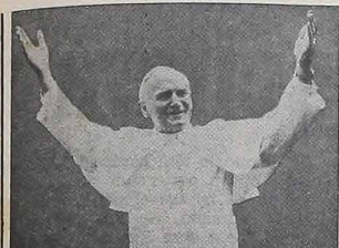
Papa João Paulo II