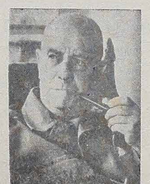
Gen. OLIMPIO MOURAO FILHO był jednym z głównych liderów Rewolucji Marcowej. On pierwszy podniósł garnizon IV Armii w Minas Gerais, by rozpocząć zwycięską marsz na Rio de Janeiro — siedzibę rządu — prezydenta Joao Goularta.

W tym czasie, gdy w kraju wybuchła rewolucja, w Rio de Janeiro, rozpoczęli marsz na Rio Garnizon Armii w Rio przeżycie na stronie Rewolucji. To samo uczyniła II Armia w São Paulo. W obronie prezydenta Goularta stanął ówczesny gubernator Leonel Brizola oraz znaczna część III Armii stacjonowanej w Rio Grande do Sul.