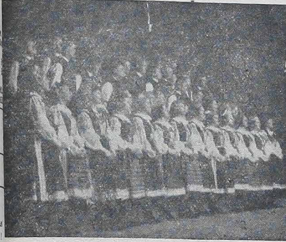
Coral do Grupo Folclórico Polonês do Paraná.

Tudo que nasce, se desenvolve e progride, não provém do nada, mas tem início, um caminho a percorrer, tem uma história. E a história é constituída de fatos. E são os homens que fazem com que os fatos aconteçam.