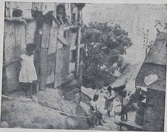
A maioria da população no ano 2000 viverá no Terceiro Mundo.

à diferença das taxas de crescimento demográfico nos países desenvolvidos e nas nações em desenvolvimento. Durante os 20 anos que restam até o término do século, a população das nações industrializadas aumentará apenas 17%. No Terceiro Mundo a população aumentará 70%. Duas causas são responsáveis por essa grande diferença nos crescimentos demográficos. Uma causa é a taxa de natalidade, que é muito alta no Terceiro Mundo; corresponde ao dobro da taxa do mundo industrializado. Outra causa é a taxa de mortalidade mais baixa. Atualmente, em média, morre mais gente em nações pobres. Mas nos próximos 20 anos será o contrário: a taxa de mortalidade será maior nos países ricos. Isto se dará porque nas nações industrializadas a idade média aumentará e a taxa de nascimentos diminuirá.