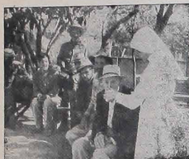
De agora em diante, todos os religiosos deverão se inscrever no INPS.

Em seu Boletim de Notícias do dia 18 de janeiro de 1980, a Conferência Nacional dos Bispos do Brasil (CNBB) publicou vários esclarecimentos referentes ao INPS PARA CLERO, RELIGIOSOS (AS) E MEMBROS DE INSTITUTOS DE VIDA CONSAGRADA: