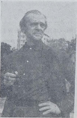
Witold Malcuzyński — o eminente pianista polonês, de fama universal, que obteve um extraordinário sucesso em Pôrto Alegre, 21 de Abril deste — em pose especial para o Jornal "Lud".

Witold Malcuzyński reapparece em Pôrto Alegre, após quatorze anos de ausência. O árbitro da pianística na Polônia, aos cinquenta anos, é um artista na maturidade existencial. Encontrou a nossa cidade desenvolvida. Tocou não mais no nosso pequeno relicário que é o Teatro São Pedro, mas no grande Auditório da URS, ante um enorme público.