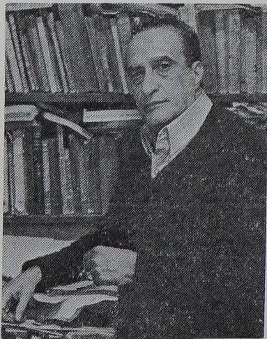
Os divorciados, geralmente, são vítimas do seu próprio egoísmo e orgulho pessoal.

Não ficou proibida a recepção do Batismo, Crisma e Comunhão dos filhos dos divorciados, contudo deverão escolher, como padrinhos, pessoas de vida normal e católicas praticantes.