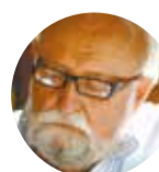
Krzysztof Penderecki polski kompozytor

Ja się lokciami nie rozpychałem nigdy, sama moja muzyka się rozpychała