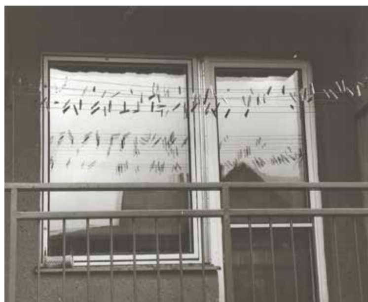
• Pogoda w ostatnich dniach nas nie rozpieszczała. Czas suszyć pranie w domowym zaciszu. Klamerki poczekają na lepsze czasy. Zdjęcie „wyrzebalony” z naszego przepastnego archiwum