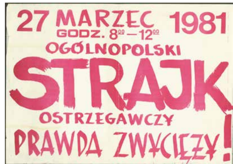
• Plakat wzywający do ogólnopolskiego strajku ostrzegawczego zaplanowanego przez NSZZ „Solidarność” na 27 marca 1981 roku.

Za lub przeciw. Trzeciego wyjścia nie ma. Polska Ludowa wprawdzie od początku narzucała nam proste alternatywy (z nią lub przeciw niej), jednak dopiero dzisiaj do wyboru zmuszono wszystkich. Wojskowy pucz nie pozostawił komfortu niezdecydowania. Nikt nie zachowa swojego azylu. Każdy musi podjąć los: przesłańdowcy, ofiary lub – przeciąwnika. (...) Zadajemy sobie pytanie, czy wal-