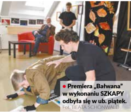
• Premiera „Bałwana” w wykonaniu SZKAPY odbyła się w ub. piątek.

Bieżący rok szkolny kładzie przed SZKAPĄ również inne wyzwania. Z jednej strony trzeba będzie rozpocząć przygotowania do przyszłorocznego jubileuszu