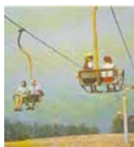
• Kolejka na Czantorii wozi turystów od 51 lat.