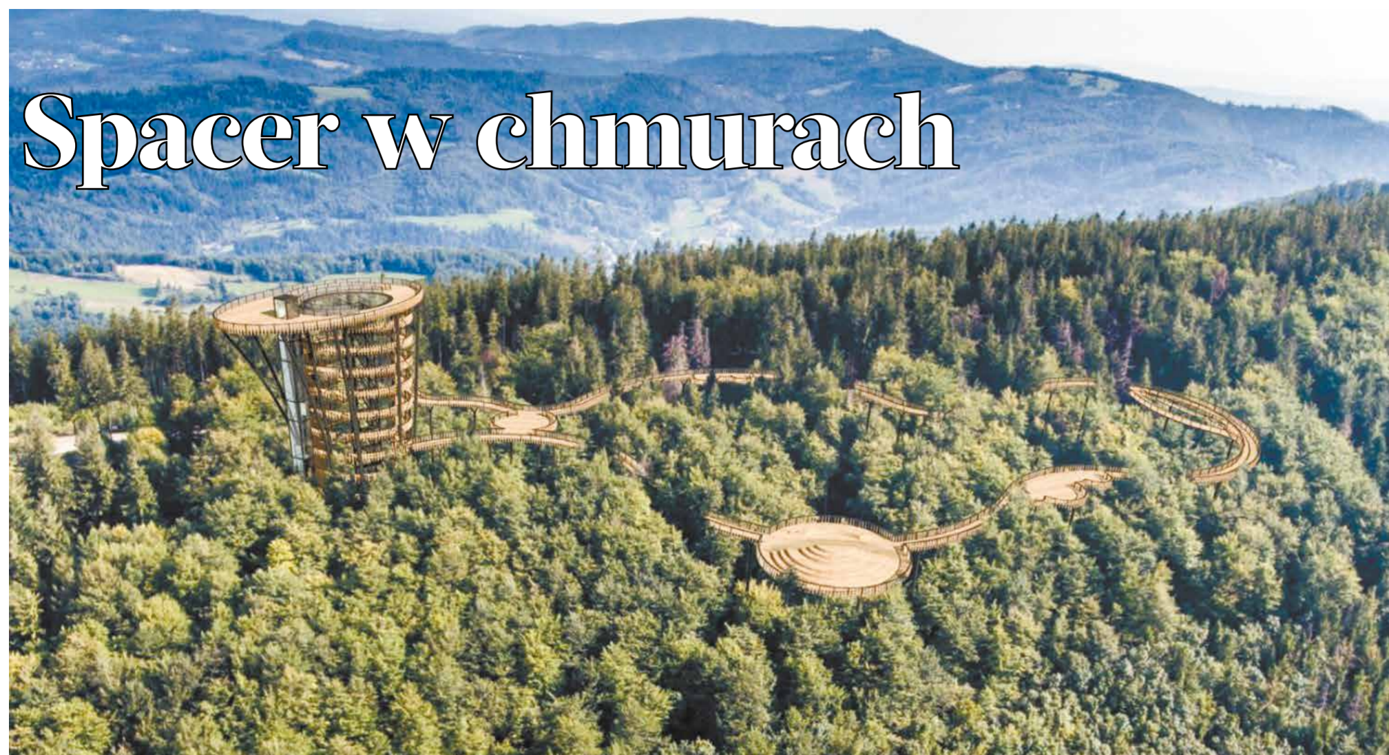
• Tak ma w przyszłości wyglądać ustronńska ścieżka w chmurach.

Za cztery lata na stokach Czantorii Wielkiej w Beskidzie Śląskim powstanie ścieżka w koronach drzew. Nowa atrakcja ma odmienić turystyczne oblicze jednej z najpopularniejszych beskidzkich gór.