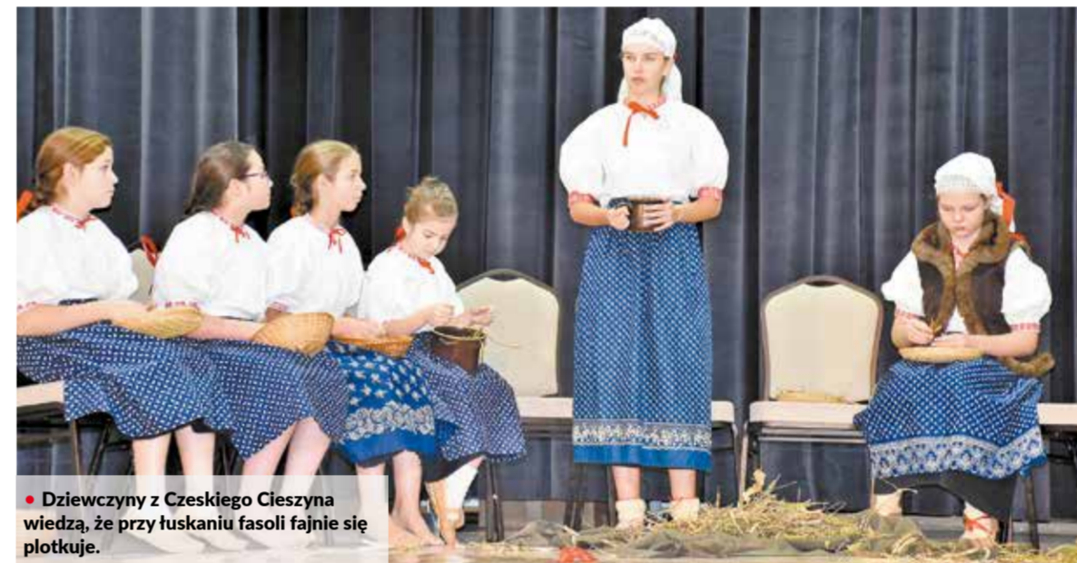
• Dziewczyny z Czeskiego Cieszyina wiedzą, że przy łusaniu fasoli fajnie się plotkuje.

Uczestnicy Konkursu Gwar popisywali się gwarowymi opowieściami i wierszami. Jedni sięgali po utwory znanych śląskich twórców, inni posłużyli się wspomnieniami i historyjkami opowiedzianymi przez rodziców lub dziadków.