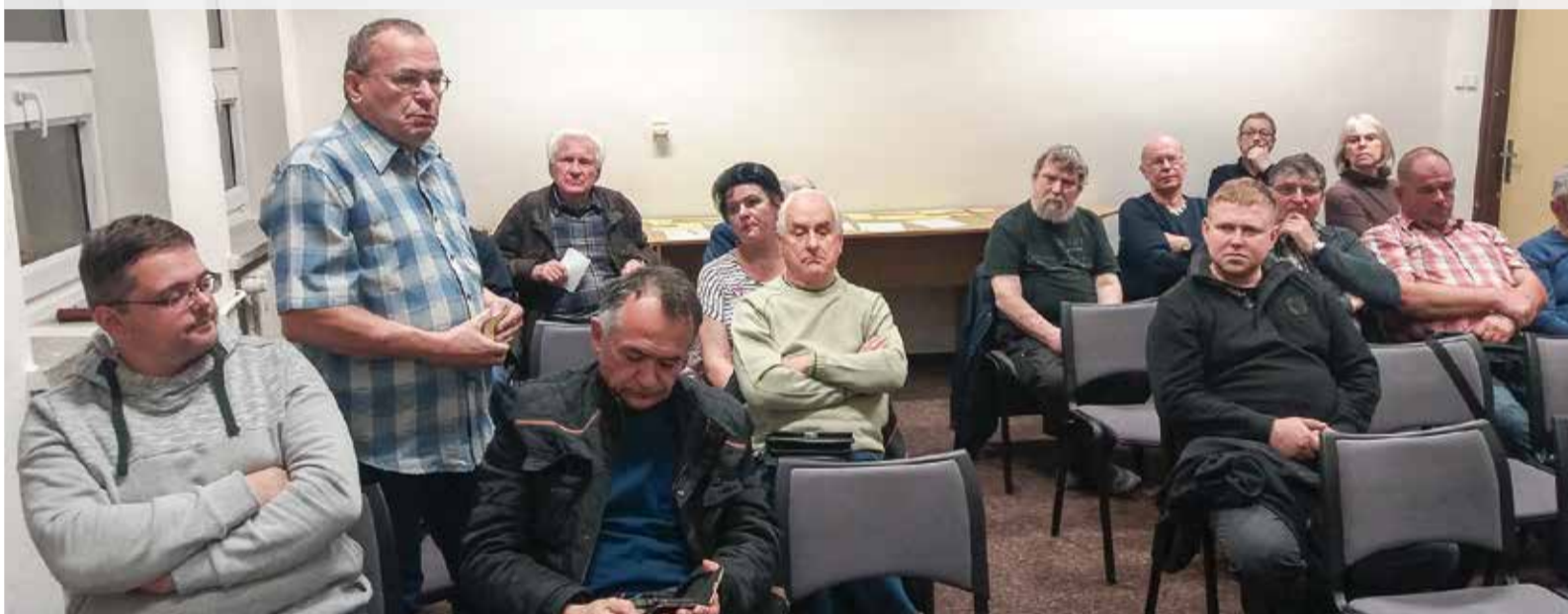
• Ostatnia Rada Przedstawicieli Kongresu Polaków w RC przebiegła bardzo sprawnie.

WYDARZENIE: Czy Zaolziacy zechcą korzystać z praw wynikających z posiadania Karty Polaka? Na swoim czwartkowym posiedzeniu Rada Przedstawicieli Kongresu Polaków w RC zobowiązała Radę Kongresu Polaków do podjęcia działań w tej sprawie.