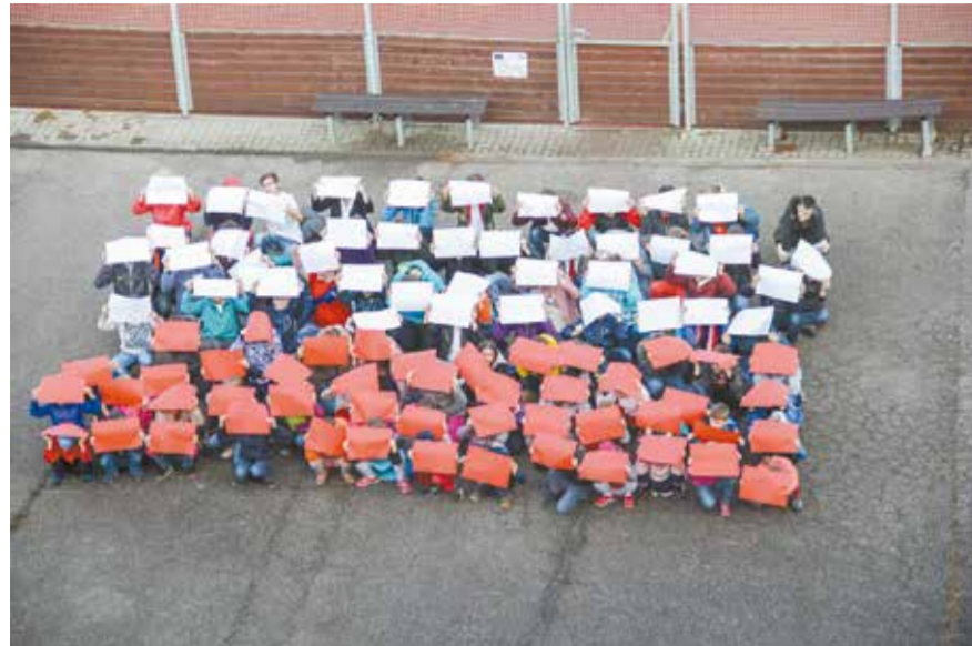
← 100 uczniów na biało-czerwono na 100-lecie niepodległości.

NAJMŁODSI TEŻ WŁĄCZYLI SIĘ W OBCHODY 100. ROCZNICY ODZYSKANIA NIEPODLEGŁOŚCI PRZEZ POLSKĘ