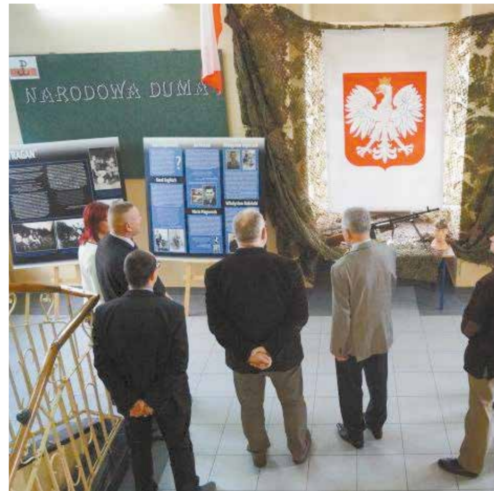
Pamięć o członkach organizacji Stragan wciąż żywa. Na zdjęciach wystawa zorganizowana w Cieszynie.

Obchodzimy stulecie odzyskania niepodległości i wspominamy także tych, którzy walczyli w różnych okresach za Polskę i polskość. Formy walki jednak nie zawsze musiały być zupełnie jawne, o czym mówi historia Zaolziaków w organizacji podziemnej.