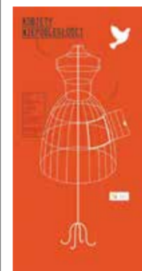
← Wystawę „Kobiety Niepodległości” można oglądać do końca roku.

Serdeczne podziękowania należą się Stowarzyszeniu „Wspólnota Polska” oraz Konsulatowi Generalnemu RP w Ostrawie za wsparcie finansowe projektu. SP w Lutyni Dolnej