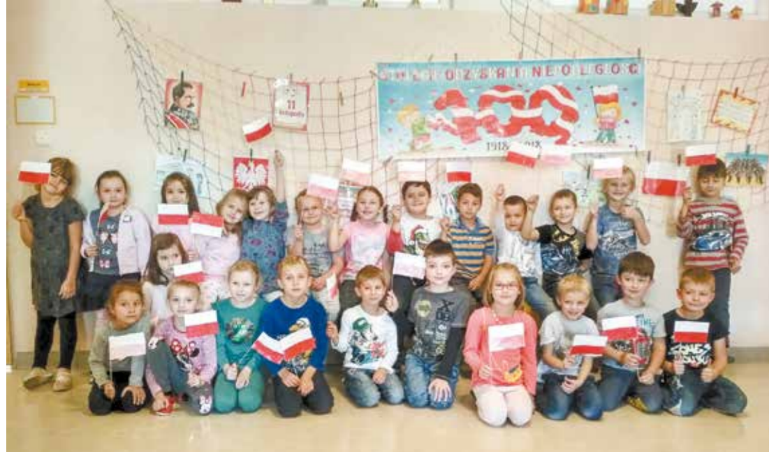
• W poniedziałek rozmawialiśmy z dziećmi o Polsce, o niepodległości kraju. Każde dziecko wykonało własną flagę i otrzymało widokówkę pamiętkową z obrazkiem setnej rocznicy obchodów niepodległości. O godzinie 11:11 w całej szkole zabrzmiał hymn – napisali go redaktorzy Iza i Ula, wychowawczynie pierwszych klas w jabłonkowskiej polskiej podstawówce. Najważniejsze, że przysłały pamiętkowe zdjęcia w biało-czerwonych barwach, które z przyjemnością publikujemy.