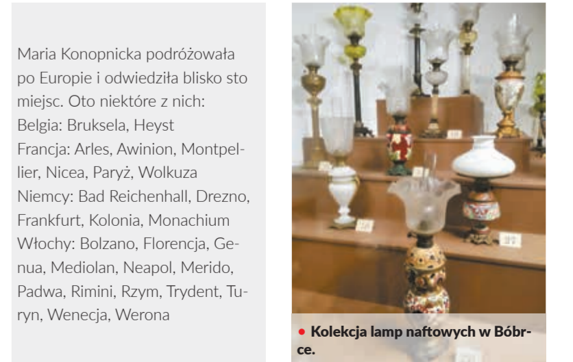
Kolekcja lamp naftowych w Bóbrce.