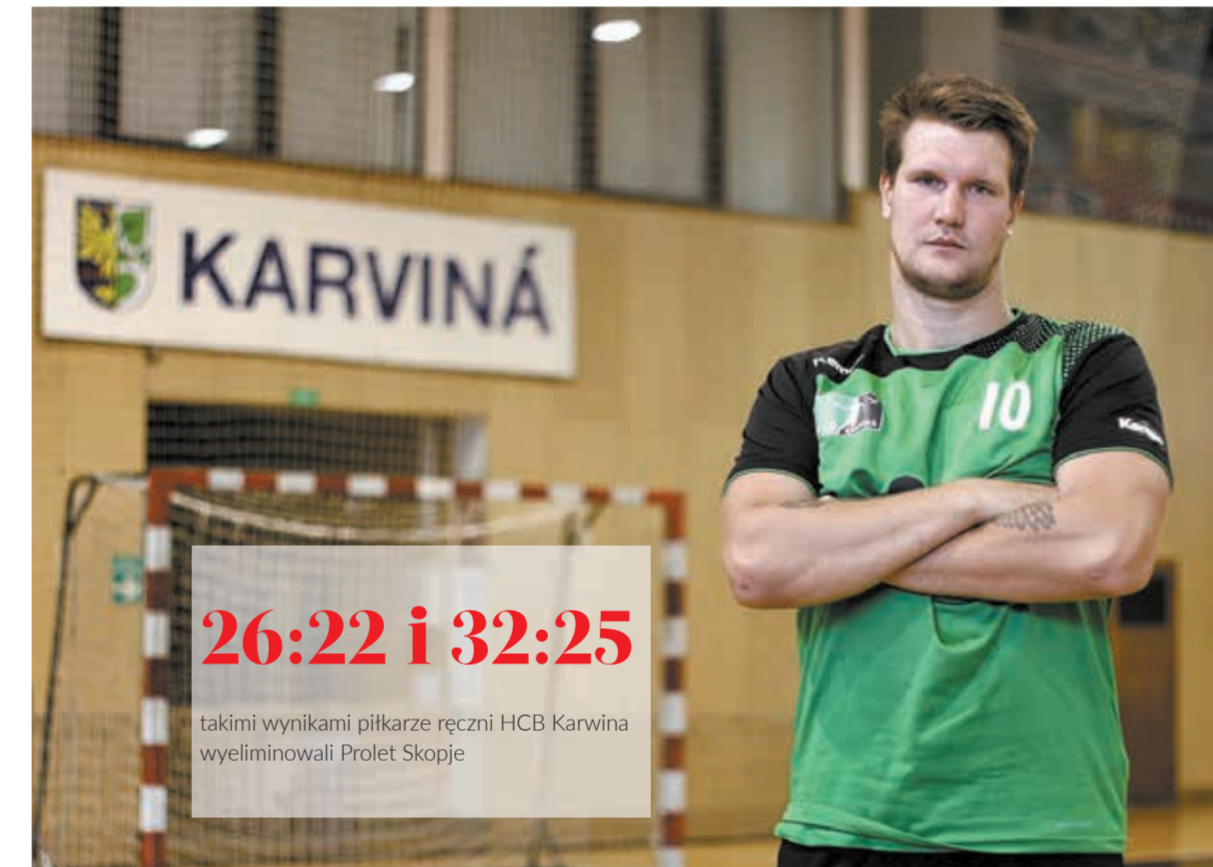
● Tymoteusz Piątek.

W trzeciej rundzie traficie na węgierski klub Balatonfüredi KSE. Była szansa gry nawet z zespoła-