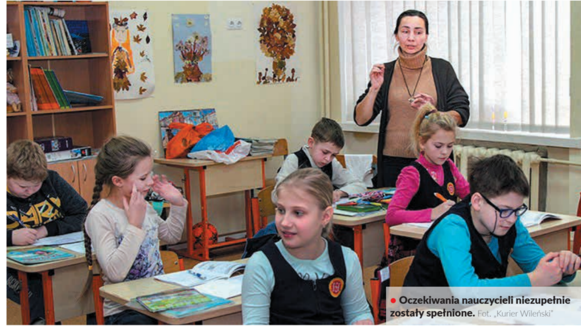
● Oczekiwania nauczycieli niepełnie zostały spełnione.

Od września w szkołach na Litwie wprowadzony został system etatowego wynagrodzenia nauczycieli. Nowy tryb obliczania wypłaty wywołał wiele dyskusji, zaś pierwsze wynagrodzenia, otrzymane z początkiem października – również rozczarowanie pedagogów.