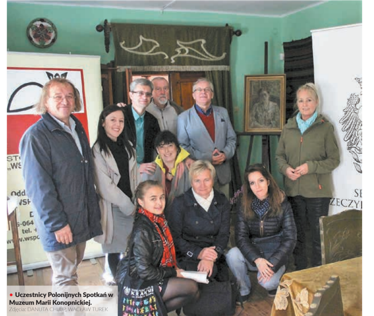
Uczestnicy Polonijnych Spotkań w Muzeum Marii Konopnickiej.

Krośnienie chlubią się także innym wielkim Polakiem, Ignacym Łukasiewiczem, który był wynalazcą lampy naftowej i pionierem przemysłu naftowego w Europie, a zarazem działaczem niepodległościowym. Wspierał m.in. powstańców styczniowych. W leżącej niedaleko Krośna Bóbrce założył w 1854 roku wraz z Tytusem Trzcieskim pierwszą na świecie spółkę naftową. Jego przystępność z surowcem ukrywającym duży potencjał przemysłowy – w tamtych czasach zwanym olejem skalnym – rozpoczęła się dwa lata wcześniej, na zapleczu apteki we Lwowie, gdzie Łukasiewicz wraz z Piotrem Mikolaschem prowadził badania nad ropą. Kontynuował je w Gorlicach, dokąd przeniósł