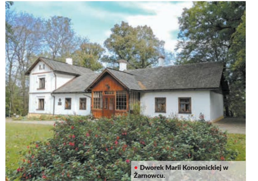
Dworek Marii Konopnickiej w Żarnowcu.

Duża kolekcja zabytkowych lamp naftowych znajduje się także na jednej z wystaw Muzeum Podkarpackiego, które ulokowane jest w wyremontowanym Pałacu Biskupim w Krośnie. A skoro już o krośnieńskich muzeach mowa, nie mogę pominąć Centrum Dziedzictwa Szklana, nowoczesnej ekspozycji przedstawiającej tradycje szklarskie Krośna i okolicy.