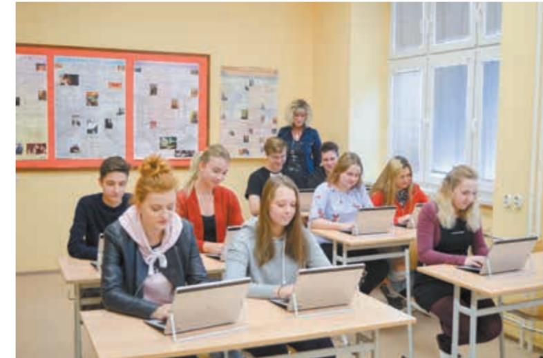
• Dzięki tabletom z klawiaturami powstała mobilna klasopracownia.

„Handlówka” posiada obecnie aż sześć klasopracowni komputerowych, lecz – jak się okazało – nawet taka liczba sprzętu nie pokrywa aktualnego zapotrzebowania. Dlatego szkoła włączyła się w program inwestycji terytorialnych aglomeracji ostrawskiej z projektem o nazwie „Digitálné vstřičná škola” („Szkoła przyszłości cyfrowa”). – Z funduszy otrzymanych w ramach projektu odnowiliśmy sprzęt komputerowy w dwóch klasopracowniach. Ponadto powstała jedna nowa, mobilna klasopracownia wyposażona w tablety. Będą one służyły do pracy na lekcjach nauk przyrodniczych oraz humanistycznych, bowiem w sześciu klasopracowniach komputerowych odbywają się przede wszystkim lekcje przedmiotów fachowych, ekonomicznych. Teraz będzie my więc nareszcie mogli wyko-