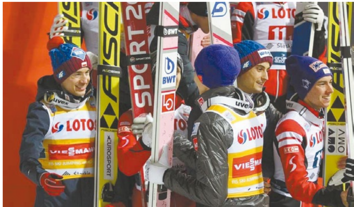
• Kamil Stoch (z lewej) przyjmuje gratulacje od kolegów z drużyny.

Polscy skoczkowie wrócili w niedzielę do kraju. O długim urlopie, na który wszyscy w pełni zasłużyli, nie może być jednak mowy. – Proszę wszystkich o wyrozumiałość. Mamy bardzo mało czasu, by się przygotować do kolejnych ważnych startów. Potrzebujemy spokoju – zaapelował do kibiców i dziennikarzy Kamil Stoch. Kolejne ważne zawody pojawią się już niebawem. Na 19-21 stycznia w niemieckim Oberstdorfie zaplanowano mistrzostwa świata w lotach, wcześniej – w najbliższy weekend – skoczkiowie sprawdzają formę na mamucim obiekcie w Bad Mitterndorf w ramach