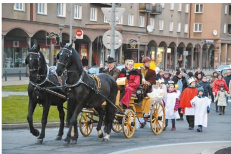
Orszak Trzech Króli przeszedł przez Trzynieć.

Orszak dotarł do Domu Kultury „Trisia”, gdzie przy żywej szopce Trzej Królowie oddali hołd Świętej Rodzinie i przekazali jej dary. Chór młodzieżowy z parafii katolickiej śpiewem upiększył popołudnie. – Orszak Trzech Króli stał się już tradycją w Trzyniecu. Bardzo cenię sobie pielęgnowanie wartości duchowych i dziękuję Caritasowi Trzynieć za to, że przez organiza-