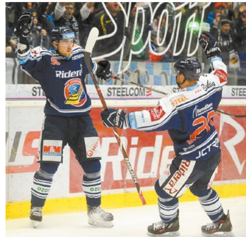
• Witkovicie idą jak burza.

Tercje: 2:0, 3:2, 1:1. Bramki i asysty: 6. Štunc (Kolouch, Kucsera), 20. Hrbas (P. Zdráhal, Baranka), 22. D. Květoň, 23. Lev (Oleš, Bartovič), 31. Kolouch (Tybor, Kucsera), 48. Lev (Roman, Tybor) – 27. M. Hanzl (K. Pilař, Trávníček), 40. Lukeš, 52. Hübl (Kubát). Witkovicie: Bartošák – Klok, Šloboda, Hrbas, Baranka, Urbanec, Trška, D. Krenželok – Oleš, Lev, Bartovič – D. Květoň, Roman, Tybor – Kucsera, Kolouch, P. Zdráhal – Štunc, Š. Stránský, Dej. Lokaty: 1. Pilno 79, 2. Hradec Kr. 71, 3. Witkovicie 70, 4. Trzyniec 67 pkt. Jutro (17.30): Pilno – Witkovicie. (jb)