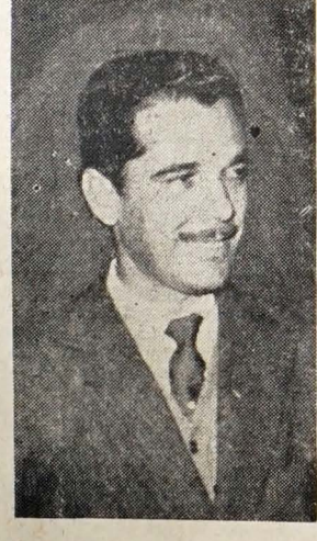
nicypalnego, usprawniając trudny problem zaopatrzenia i aprowizacji miasta. Zainstalował w mieście 10 tys. telefonów automatycznych.

Należy jeszcze nadmienić, że Ney Braga był kolegą szkolnym Jania Quadrosa, uczęszczającym z nim do Gimnazjum Paranańskiego, w Kurytybie, prowadzonego przed kilkunastu laty przez Księży Misjonarzy — prowincji brazylilijskiej.