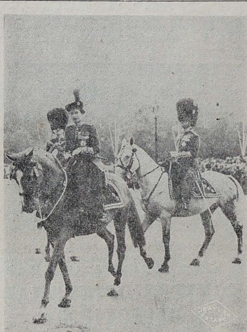
KRÓLOWA ANGIELSKA ELŻBIETA II w mundurze pułkownika Gwardii królewskiej pod nazwą "Goldstream Guards" wraca po paradzie do pałacu Buckingham ze swym mężem.

Dalsze pięciolatek, do roku 1965, przeznaczone jest w planie Mao-Tse-Tunga na opanowanie "pokojujmy" środkami reszty Azji z Indiami i Ceylonem. W dalszych etapach plan przewiduje "pokojujmy" zdobycie Japonii oraz opanowanie środków rewolucyjnymi Filipin, Środkowego Wschodu z jego państwami arabskimi oraz całej Afryki do roku 1975. Zdoby-