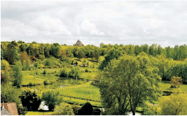
Widok z zamku na cmentarz Vue de Château au cimetière

Kolejne polskie ślady prowadzą na mały cmentarz, gdzie zostali pochowani członkowie bliższej i dalszej rodziny oraz przyjaciele polskich właścicieli zamku — ponad sześćdziesiąt osób.