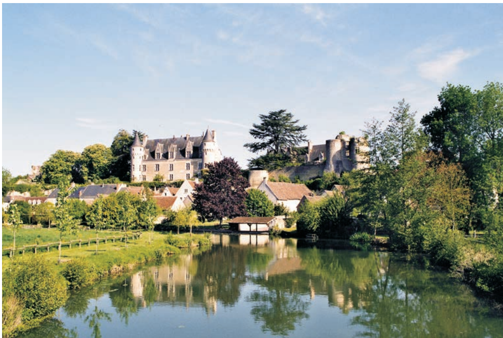
Zamek w Montrésor Le Château de Montrésor

starnay, szambelan Ludwika XI, a następnie za panowania Karola VIII, od 1497 r. ambasador w Hiszpanii. Ze względu na brak badań archeologicznych nie wiadomo dokładnie jak wyglądał jego nowy zamek „w stylu Ludwika XII”. Z fundacji Bastarnayów pochodzi wczesnorenesansowy kościół (obecnie kościół parafialny), który miał pełnić funkcje ich mauzoleum. Dotychczas w nawie głównej znajduje się wspaniale zachowany renesansowy, marmurowy nagrobek przedstawiający leżące postacie Ymberta de Bastarnay (zm. 1523), jego żony Georgette de Monchenu (zm. 1511) oraz ich syna François (zm. 1513), odnowiony dzięki pierwszemu polskiemu właścicielowi w 1875 r.