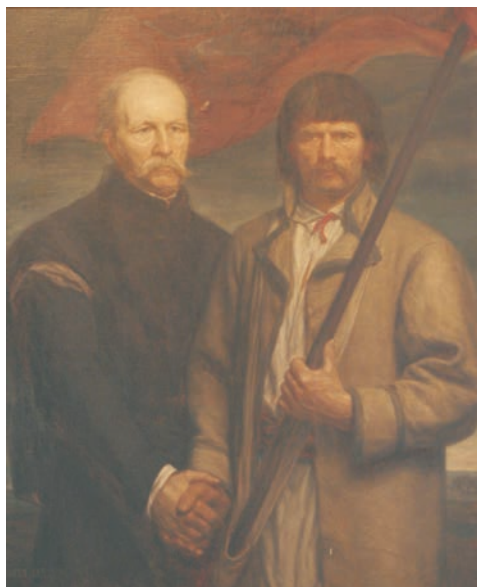
Szlachta i lud La noblesse et le peuple

Pour apporter son soutien aux artistes polonais, Xavier Branicki achetait volontiers des tableaux présentant des thèmes patriotiques, surtout l'insurrection de janvier 1863. Ainsi ses collections contiennent des tableaux «de peintres quelque peu médiocres», par exemple celui de Jan Mioduszewski (1831 – après 1887), pourtant réaliste, représentant trois chiens déchirant un mor-