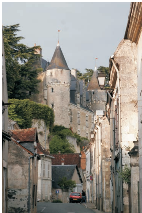
Zamek w Montrésor Le Château de Montrésor