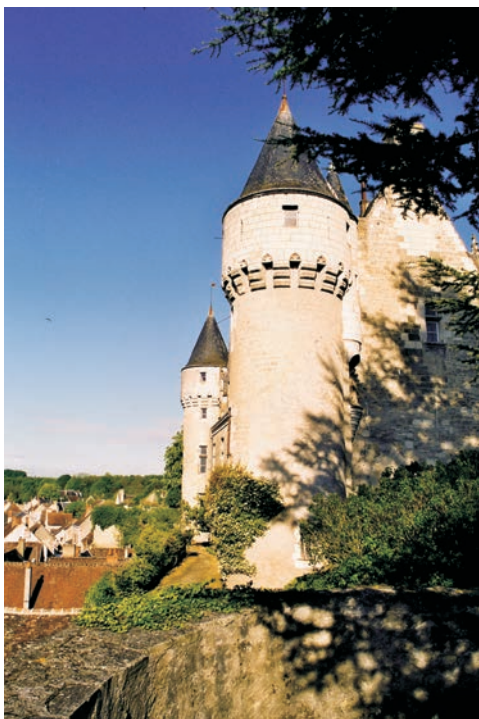
Zamek Le Château