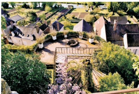
Widok z zamku Montrésor Vue de Château de Montrésor

czna południowa fasada, z dwiema okrągłymi wieżami na narożach, jest więc inwencją XIX-wiecznego architekta (...). Branicycy zastali wzgórze otoczone z trzech stron dwiema liniami potężnych murów obronnych – wyższą z basztami, niższą z przysadzistymi artyleryjskimi «rondlami» – oraz murem umacniającym stok południowy wzgórza, a łączącym się z resztą średnio-wiecznej wieży bramnej. W obrębie murów stał ów gotycko-renesansowy korpus (...) (tzw. stary dom) oraz jakies zabudowania oparte o północno-wschodnie odcinki wewnętrznego muru – z wypełnieniem wykrojów krenelażu – w tym mieszkalny «nowy dom» o zatartych cechach stylowych, dawny, ale z neogotyckimi elementami kamieniarki. Trzeba było więc postawić bramę, od wschodu przystosować do celów gospodarczych i mieszkalnych służby jeden budynek wraz z kuchnią, od północnego wschodu adaptować «nowy dom», a w nim m.in. wozownię i inne pomieszczenia służbowe. Doszła do tego szopa w części północnej i dość obszerne zabudowania ogrodnicze – w za-