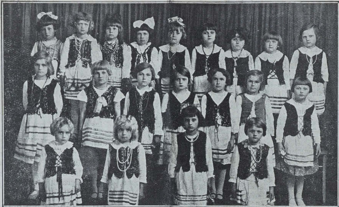
LES PETITES « CRACOVIENNES » SONT NÉES ET GRANDISSENT CHEZ NOUS EN FRANCE