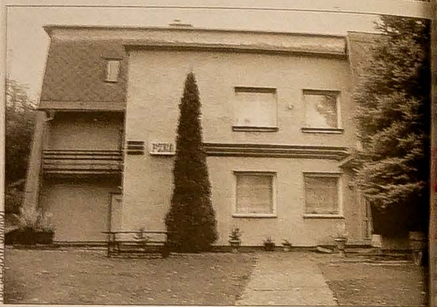
Dom PZKO w Lesznej Dolnej